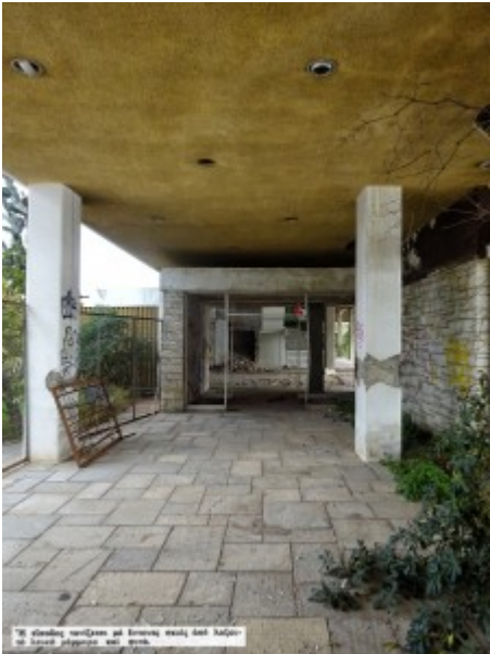
Η είσοδος πραγματοποιείται από την οροφή και διαφέρει με έναν πάγκο και μια.