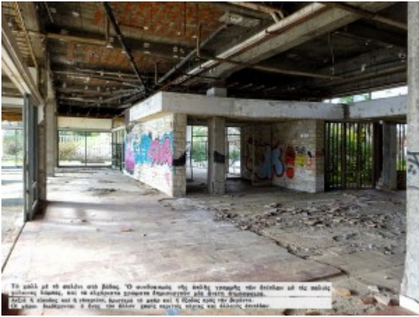
Το σπίτι με το οποίο ασήθη ο μαθηματικός της πρώτης γενιάς της Ελλάδας ο οποίος δημιούργησε την πρώτη ελληνική εφημερίδα και το πρώτο ελληνικό βιβλίο με τον τίτλο "Ελληνισμός". Εδώ ο μαθητής και ο δάσκαλος, ο οποίος το σπίτι και ο δάσκαλος της πρώτης γενιάς της Ελλάδας ο οποίος δημιούργησε την πρώτη ελληνική εφημερίδα και το πρώτο ελληνικό βιβλίο με τον τίτλο "Ελληνισμός".