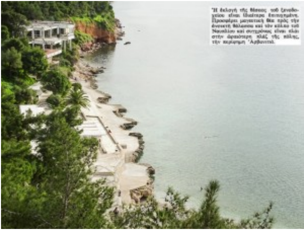
Η θέα από την αίθουσα των εργασιών είναι υπέροχη. Προσφέρει μαγευτικά θέα προς την άκρως βόρεια και την κόλαση του Νεοκλήου και περιτριμμένη είναι μέσα στην άρρακτη ομίχλη της πόλης, την κωπηλατή 'Αθήνας.