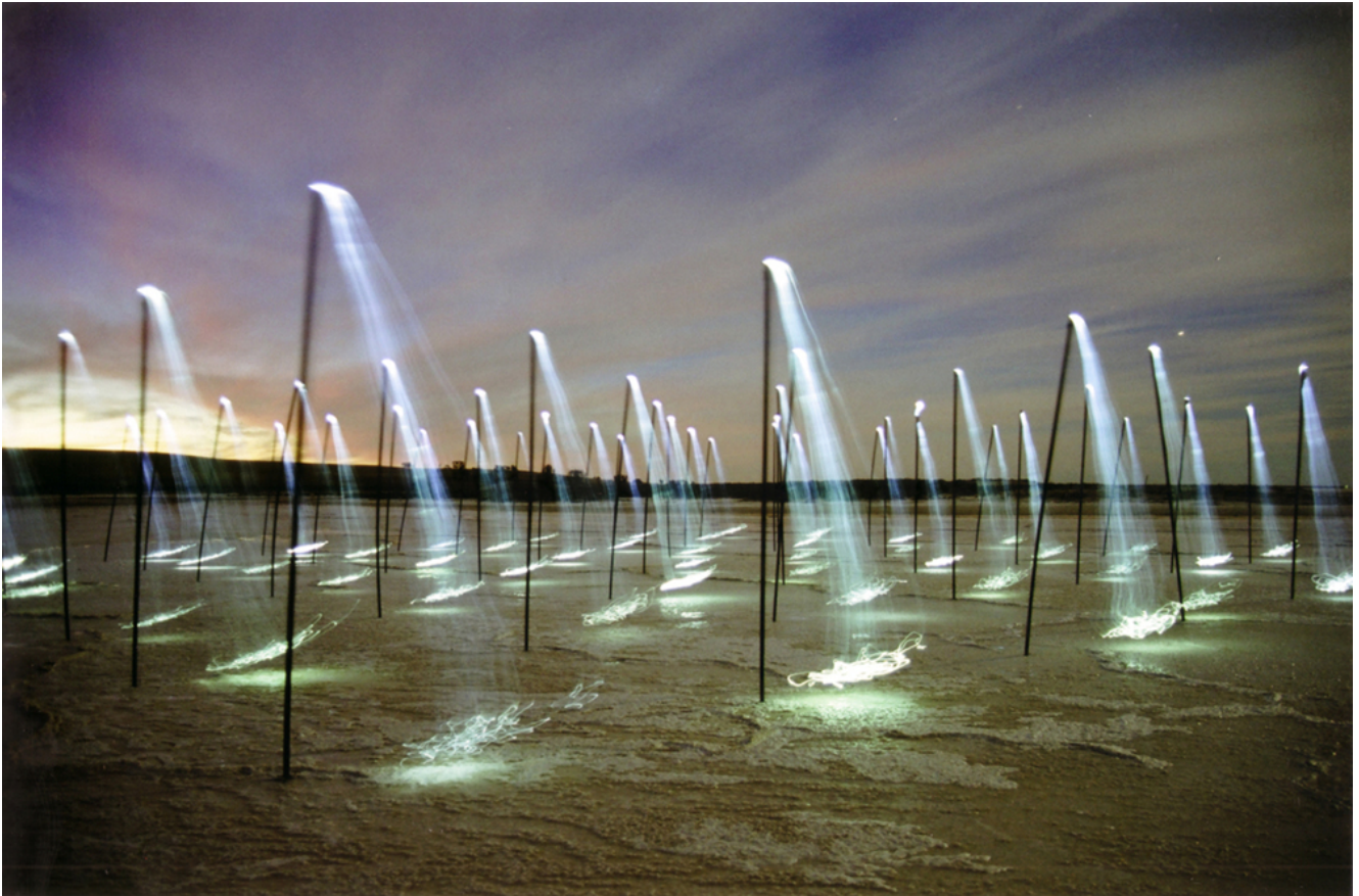
The Transference Field, Slovakia, 2013