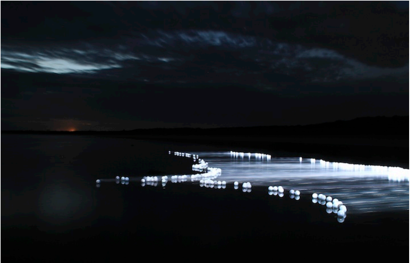
The flow project, Wild dog creek, 2011

Άλλα μέρη τα επιλέγει εξαιτίας ίσως του τρόπου που τα δέντρα αναπτύσσονται , τον τρόπο που κινείται ένα ποτάμι γύρω από τις πέτρες αλλά και για τον τρόπο που η γη συναντά τη θάλασσα. Και αυτό είναι κάτι που τον προκαλεί να δουλέψει και να το τονίσει με φως.