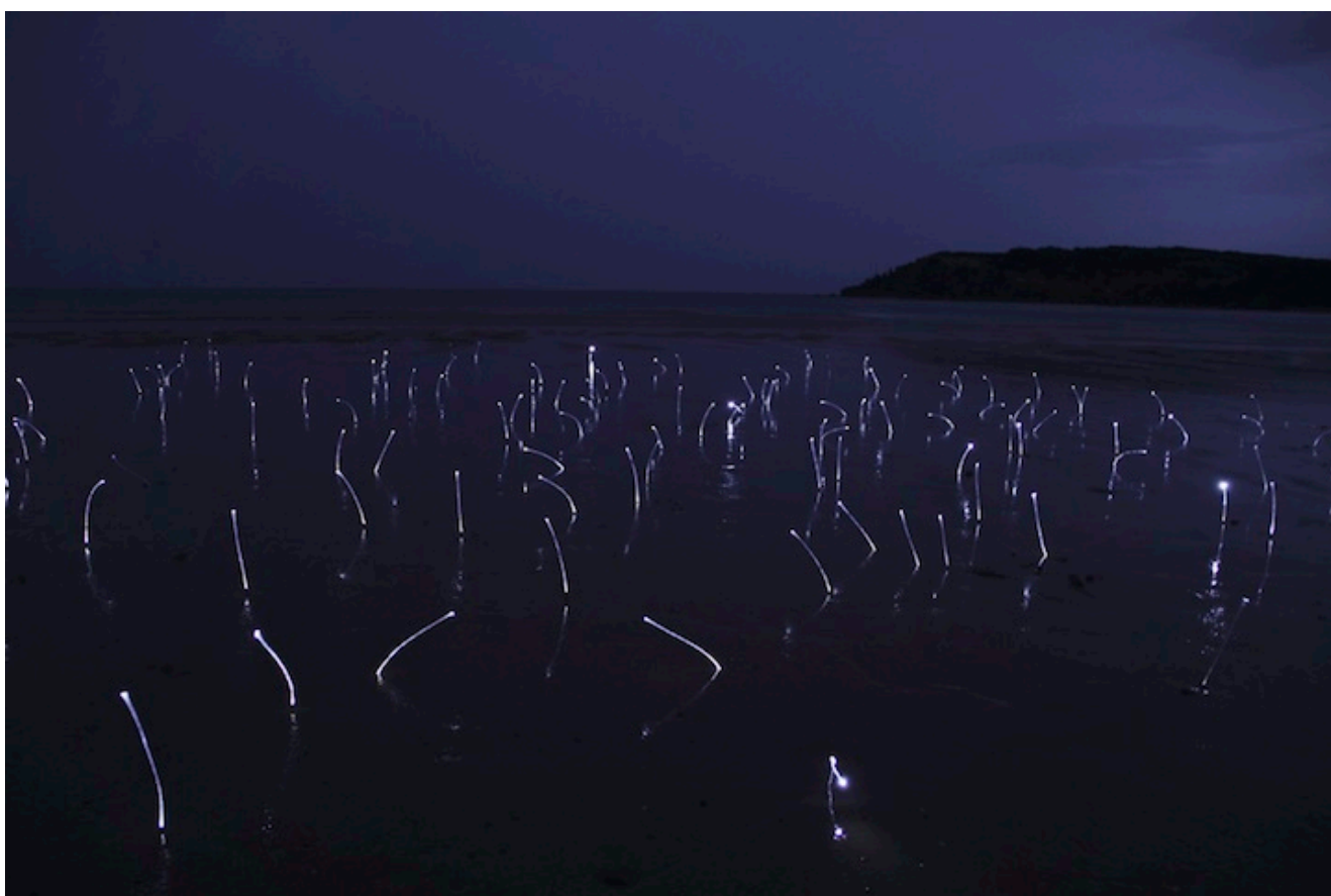
Threshold, Ocean Grove , 2011

Η επιλογή της εκάστοτε τεχνολογίας εξαρτάται από το ίδιο το έργο. Συνήθως χρησιμοποιεί LED ενώ όταν δεν υπάρχει η δυνατότητα παροχής ενέργειας χρησιμοποιεί μπαταρίες. Πολύ συχνά χρησιμοποιεί και οπτικές ίνες, όπως στο έργο Threshold , καθώς είναι εύκαμπτες και παρέχουν έναν οργανικό τρόπο στη μεταφορά φωτός, όπως ένας σωλήνας νερού.