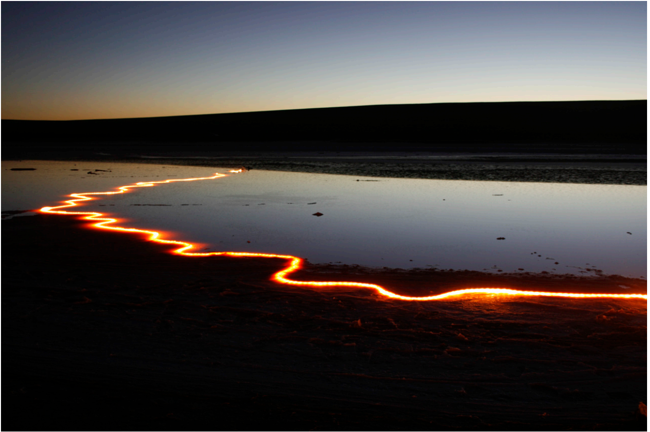
Arc One, Λίμνη Tyrrell, 2009

Τα έργα του είναι ενεργειακά αποδοτικά και ευαίσθητα με το φυσικό περιβάλλον. Με την εφήμερη φύση τους προσπαθούν να θυμίσουν ότι ο κόσμος επικοινωνεί με μας μέσα από την αλλαγή των εποχών, του κλίματος και της τοπιογραφίας.