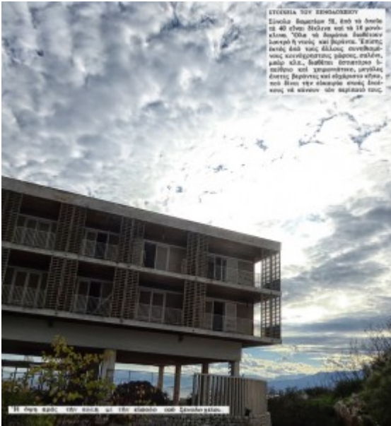
ΕΥΧΑΙΡΙΑ ΣΤΗ ΖΕΜΑΧΑΚΕΩΝ Είναι η διαμονή 50, που το δωμάτιο 40 είναι ιδιαίτερα και το 14 γενικά είναι. Όλα τα δωμάτια διαθέτουν δωρεάν Wi-Fi και μπαλκόνι. Έχουμε επίσης ένα από τους καλύτερα συνδυασμούς κουζίνας/πάρκου, μπάνιο, αλλά και... διαθέτουμε δωμάτιο 5-πύλας και υπηρεσίες, υπηρεσίες όπως βερνίκι και σιδερένιο κλπ. η οποία είναι για όλους τους δωμάτια να κάνουν ένα κεντρικό τους.